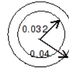
Section du tuyau

Section tubulaire de rayon extérieur a=0.04\text{m} , de rayon interne b=0.032\text{m} , d'épaisseur e=0.008\text{m} .