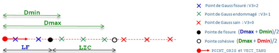
Figure 2 : Schéma du champ de PG d'une fissure cohésive 2D rectiligne avec la position des pointes

Pour définir la position des pointes (voir figure 2) on s'appuie sur les coordonnées géométriques des PG et sur le champ de la variable interne VARI_ELGA composante V3 des lois CZM qui prend comme valeur 0 si le PG est sain, 1 si le PG est endommagé et 2 si le PG est fissuré. Pour chacun de ces trois états on définit Dmin et Dmax correspondant aux distances minimale et maximale par rapport au point origine. La pointe de fissure est positionnée entre les PG cassés et les PG endommagés, la pointe cohésive est positionnée entre les PG endommagés et les PG sains.